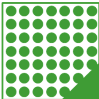
ORAFLEX® 11526 souple