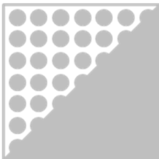
ORAFLEX® 11552 средняя