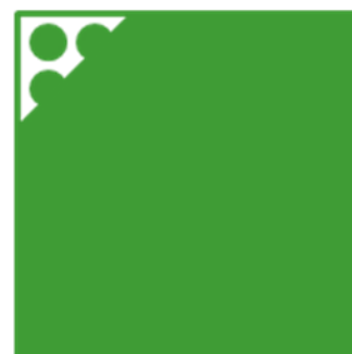
ORAFLEX® 11686 rigido