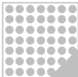
ORAFLEX® 11626 morbido