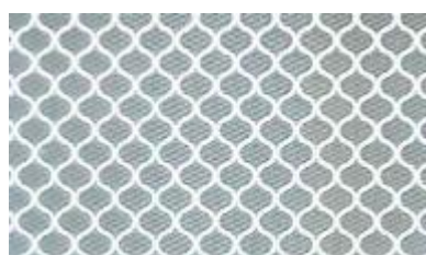
Figura 1 – Estructura celular y direcciones de aplicación

ORALITE® 6910T Brilliant Grade Translucent está disponible en los colores blanco (010) y amarillo (020), así como en amarillo verdoso fluorescente (029) y amarillo fluorescente (037). Los colores reflejados, medidos según las correspondientes especificaciones de la CIE nº 15.2, cumplen con los requisitos de las tablas 3 y 4, y con los valores según DIN 6171: 2013-10. A título informativo se indican también los factores de ganancia fluorescentes.