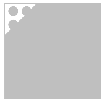
ORAFLEX® 11685 Hart