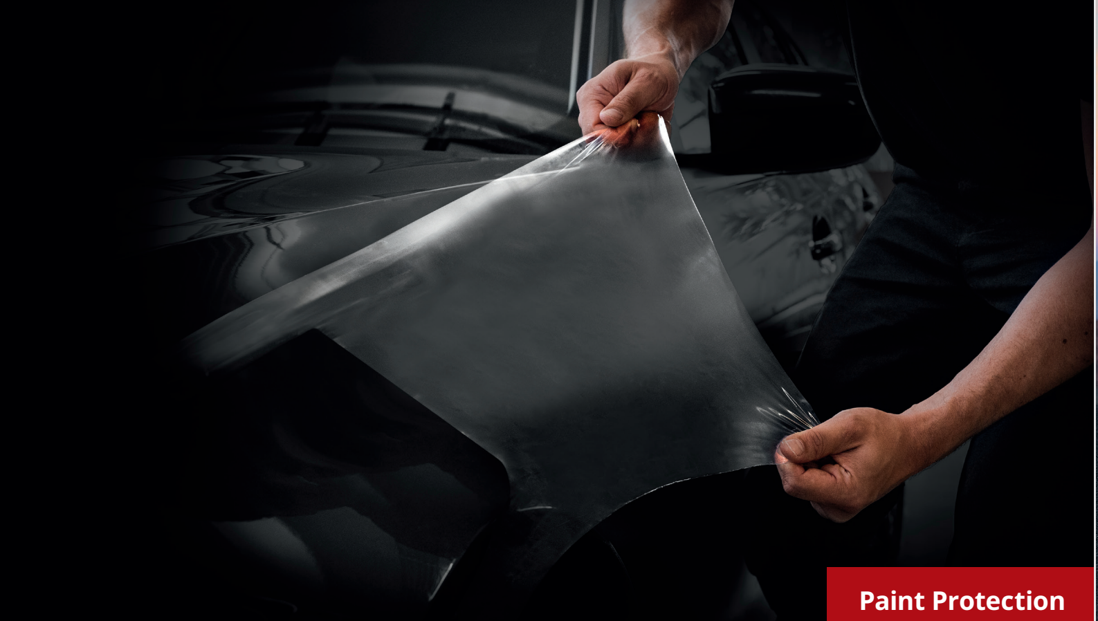
Paint Protection von ORAFOL