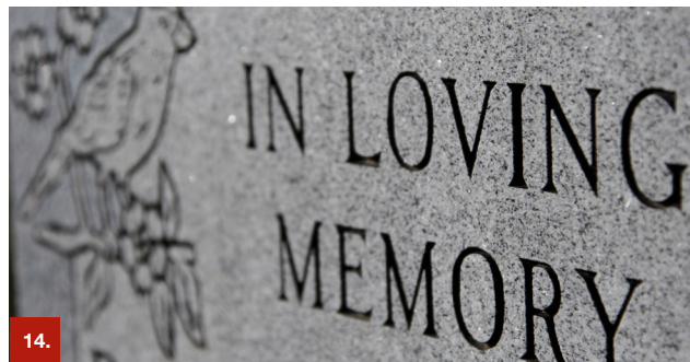
Beispiel 14 ORAMASK® 831/832