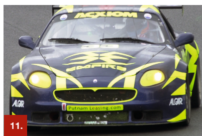
Beispiel 11 ORACAL® 7510