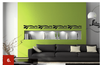
Beispiel 6 ORACAL® 638