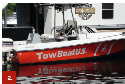
Beispiel 2 ORACAL® 751C