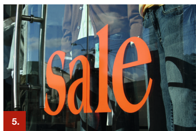
Beispiel 5 ORACAL® 641