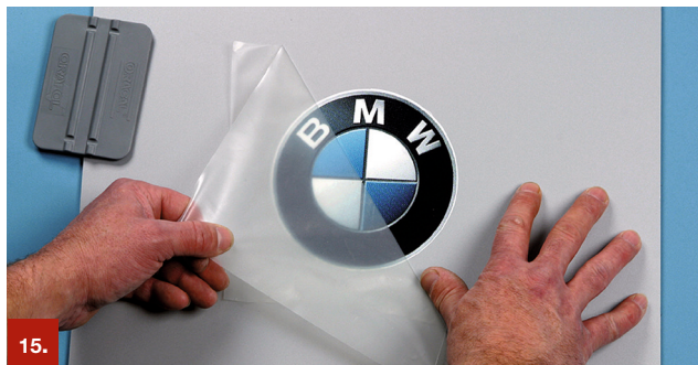
Beispiel 15 ORATAPE® MT95

Die Übertragungspapiere ORATAPE® LT52 und ORATAPE® LT72 sind für Anwendungen nach der Trockenverklebungsmethode geeignet. ORATAPE® MT52 für Anwendungen, die eine mittlere Klebkraft, ORATAPE® LT52 und ORATAPE® LT72 für Anwendungen, die eine außergewöhnlich geringe Klebkraft erfordern. Die halbtransparenten Übertragungspapiere mit einem speziell eingestellten Naturkautschukkleber gewährleisten sowohl die sichere Haftung auf dem zu übertragenden Material als auch die problemlose Entfernbarkeit nach der Übertragung.