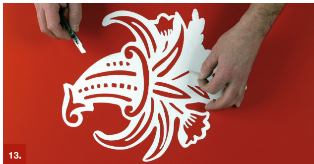
Beispiel 13 ORAMASK® 810

Diese 0,23 mm bzw. 0,35 mm dicken Spezial-PVC-Folien wurden für die vielfältigen Anwendungen von Steinmetzen und Kunstsandstrahlstudios entwickelt. Sie werden bevorzugt für das Sandstrahlen von Glas, Kunststoff und Holz eingesetzt.