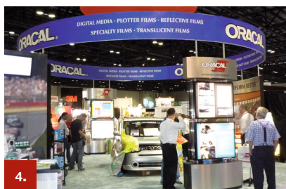
Beispiel 4 ORACAL® 631

Speziell für das Bekleben von Bannern, Banden und anderen flexiblen Untergründen wurde diese Plotterfolie entwickelt. Sie passt sich dem Untergrund optimal an und haftet auch bei sehr hohen Beanspruchungen. Die Folie gewährleistet darüber hinaus eine gute und rückstands-freie Wiederentfernbarkeit. Eine seidenmatte Oberfläche und 24 Farben lassen anspruchsvolle Gestaltungen zu.