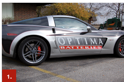
Beispiel 1 ORACAL® 951

Diese Plotterfolie wurde für den kurz- und mittelfristigen Einsatz in der Innen- und Außenwerbung konzipiert. Universelle Verarbeitungseigenschaften sowie 59 brillante Farben in glänzend und 56 Farben in matt machen sie interessant für eine breite Palette an Dekorationsarbeiten. Sie besitzt eine ausgezeichnete Opazität und ist mit ihrem permanent haftenden Solvent-Polyacrylat-Haftklebstoff für eine Haltbarkeit im Außenbereich von bis zu 5 Jahren ausgelegt.