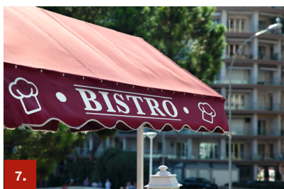
Beispiel 7 ORACAL® 451

Diese UV-stabilisierte, transparent eingefärbte, glänzende Spezialfolie mit einer Haltbarkeit von bis zu 5 Jahren dient der Herstellung von hochwertigen Leuchtwerbbeanlagen und zur Gestaltung von hinterleuchteten Glasflächen. 32 brillante Transparentfarben sowie die Schaffung von Zwischentönen durch das Übereinanderkleben der Folien eröffnen unbegrenzte kreative Möglichkeiten.