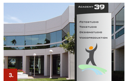
Beispiel 3 ORACAL® 551