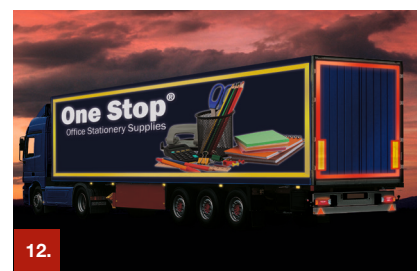
Beispiel 12 ORALITE® 5600E