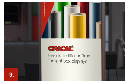
Beispiel 9 ORACAL® 8830