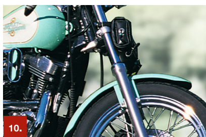
Beispiel 10 ORACAL® 383

Die RapidAir®-Technologie der Serie 5650RA FLEET ENGINEER GRADE erlaubt ein schnelles und einfaches Verkleben, wobei sich insbesondere bei großflächigen Anwendungen das Entstehen von Bläschen und Falten reduziert.