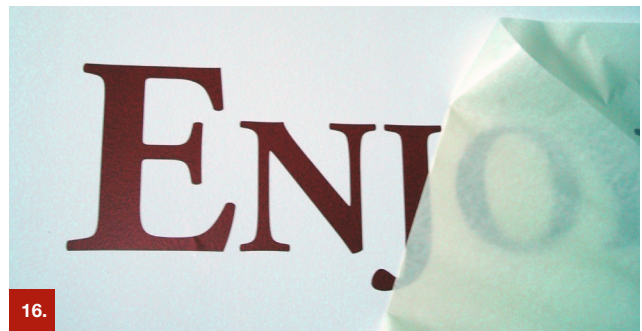
Beispiel 16 ORATAPE® LT52