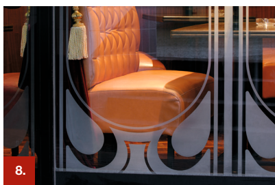
Beispiel 8 ORACAL® 8810