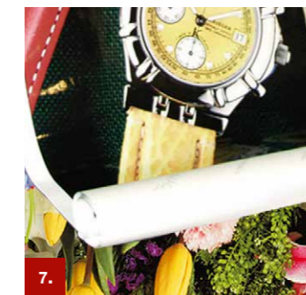
Beispiel 7 ORACAL® 1610