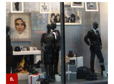
Beispiel 8 ORACAL® 1640HT