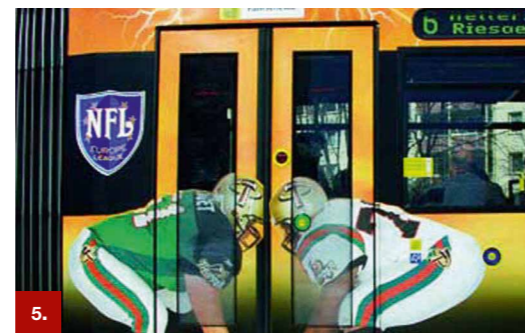
Beispiel 5 ORACAL® 1668