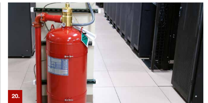
Beispiel 20 ORALUX® 9300