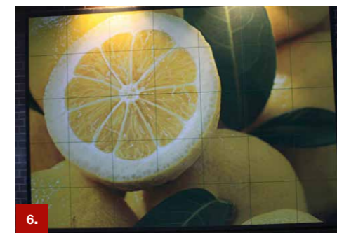
Beispiel 6 ORACAL® 1640

Für Fußbodenwerbung in Verbindung mit ORAGUARD® Schutzlaminat 250AS oder 255AS. Das Material hat eine ausgezeichnete Opazität, so dass Farbschattierungen des Fußbodens abgedeckt werden. Der Haftklebstoff garantiert eine rückstandsfreie Entfernbarkeit.