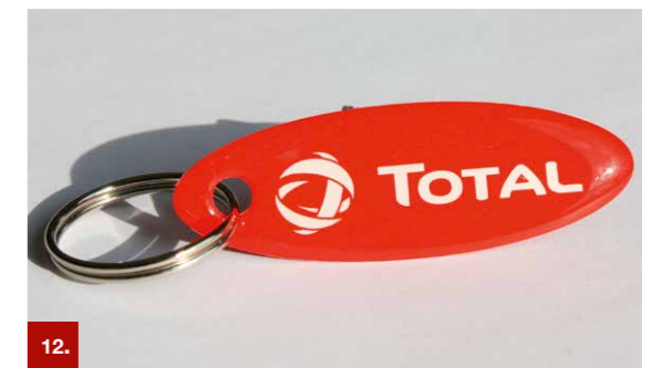
Beispiel 13 ORACAL® 301F