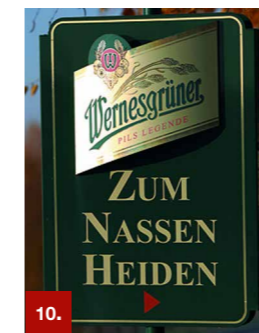
Beispiel 11 ORACAL® 352