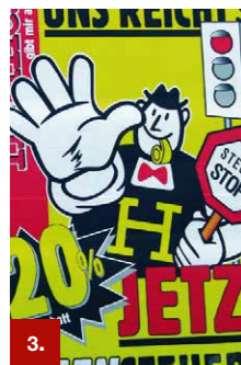
Beispiel 3 ORACAL® 1670

Diese Serien wurden ebenfalls für den hochwertigen Sieb-, UV-Offset- und Flexodruck entwickelt. Überall dort, wo eine hohe Feuchtigkeitsbelastung der Verklebung auftritt, wird der wasserbeständige Hochleistungsacrykleber der Serie 1650 empfohlen. Wird außerdem eine rückstandsfreie Entfernung auch nach 2 Jahren Verklebungszeit gefordert, empfiehlt sich der wasserbeständige Hochleistungsacrykleber der Serie 1630. Beide Folien sind für kurz- und mittelfristige Markierungen, Beschriftungen und Dekorationen im Außenbereich geeignet.