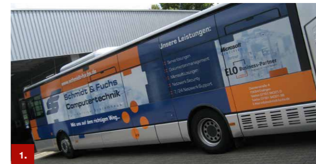
Beispiel 1 ORACAL® 952 / 953

Die lichteichte und witterungsbeständige Serie 552 wurde speziell für die hochwertige und langlebige Fahrzeugdekoration entwickelt. Sie ist für hochwertigen Siebdruck, für Beschriftungen, Markierungen und Dekorationen mit höchsten Anforderungen an Belastbarkeit und Haltbarkeit geeignet. Diese Folie ist in weiß und transparent mit glänzender Oberfläche verfügbar. Der permanent haftende, seewasserbeständige Hochleistungsacrylkleber erfüllt höchste Ansprüche.