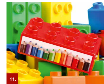
Beispiel 12 ORACAL® 1740/1720