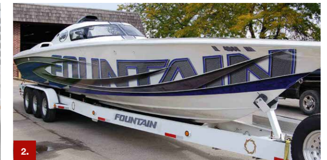
Beispiel 2 ORACAL® 1050