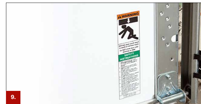
Beispiel 10 ORACAL® 620

Diese umwelt- und gesundheitsfreundlichen Weich-PVC-Folien sind für kurz- und mittelfristige Markierungen, Beschriftungen und Dekorationen im Außeneinsatz geeignet. Im Inneneinsatz sind sie nahezu unbegrenzt haltbar. Die Folien erfüllen die Anforderungen der EU-Richtlinien 2005/84/EG (Phthalate in Spielzeug und Babyartikeln). Serie 640PF ist mit einem permanenten, Serie 620PF mit einem ablösbaren Polyacrylatkleber ausgestattet.