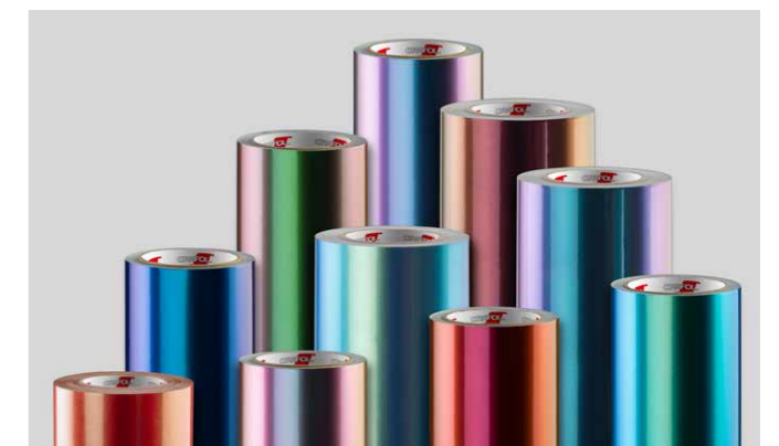
ORACAL® 970 Premium Shift Effect Cast