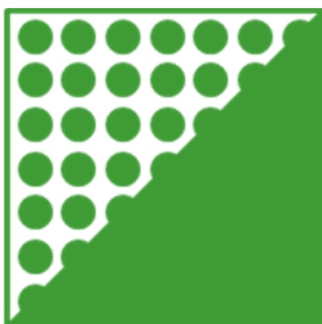
ORAFLEX® 11552 средняя